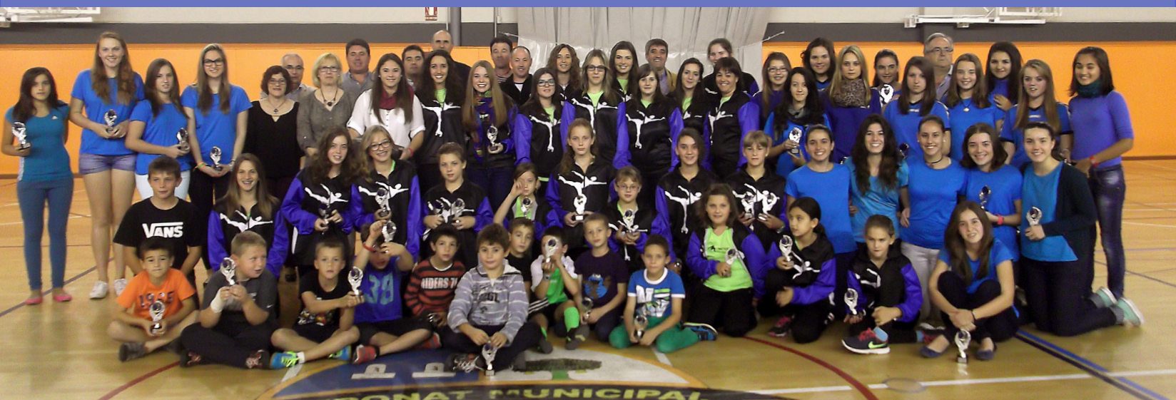
PREMIS ANUALS DE L'ESPORT