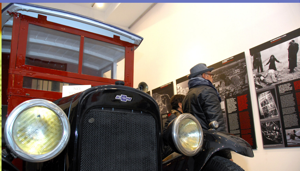
CDI CAL CATALÀ EXPOSICIÓ CATALUNYA BOMBARDEJADA